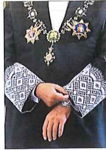
Un magistrado con su toga.

jóvenes participantes en la Garantía Juvenil con contrato de formación. Esta partida ya apareció en 2017 y pese a que hubo un pacto con Ciudadanos y los agentes sociales, finalmente la ayuda no vio la luz. Esta vez el desarrollo está incluido en la norma presupuestaria. En este punto también se incluyen las bonificaciones, 1.936 millones, o los fondos de formación, 2.331 millones.