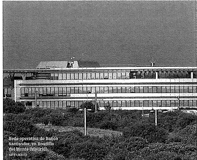
Rede operativa de Banco Santander, en Boadilla del Monte (Madrid).

► El FMI ha reclamado recientemente una mayor consolidación y diversificación del sistema financiero español, que incluya el cierre de más sucursales, para abordar y aprimir el actual escenario de baja rentabilidad bancaria.