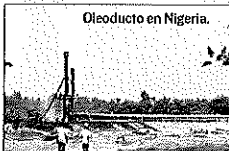
Oleoducto en Nigeria.

Es el país africano que muestra con más precisión el ajuste sufrido por las naciones del África Subsahariana, que ha pasado de crecer un 3,4% en 2015 a un 1,4% en 2016. El PIB caerá en Nigeria un 1,7%, en gran medida