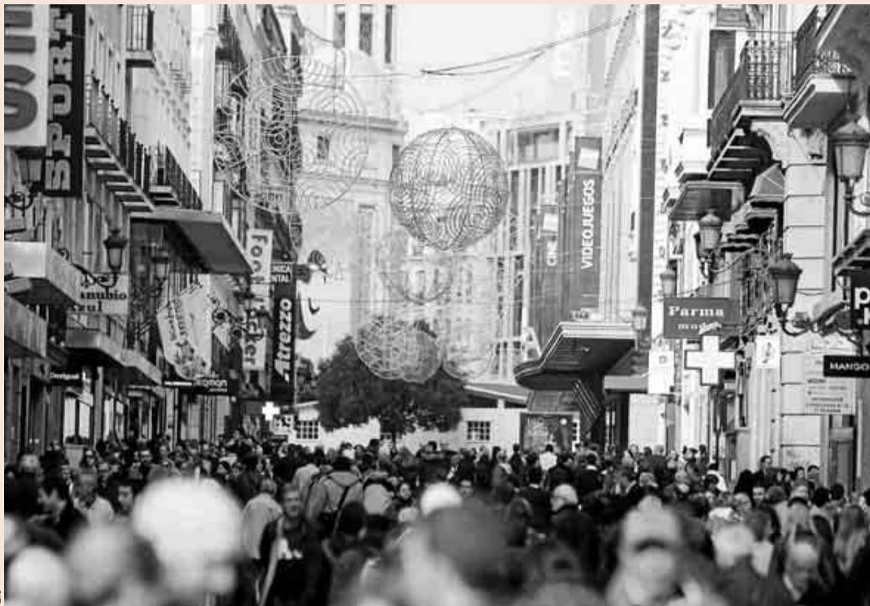
Para la mayoría de los comercios la época navideña sigue siendo la clave de sus resultados. En la imagen, la calle Preciados de Madrid.

En nuestra última edición de El Observatorio Cetelem Consumo España 2014, ya notamos una cierta recuperación del consumo doméstico cuatro de los siete sectores analizados en años anteriores.