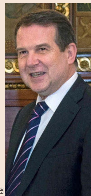
El presidente de la Femp y alcalde de Vigo, Abel Caballero.

La Comisión de expertos para la reforma de la financiación autonómica, por su parte, se reunió la pasada semana, y volverá a citarse el próximo 7 de marzo.