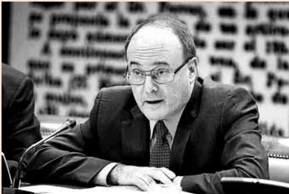
El gobernador del Banco de España, Luis Linde, ayer en el Senado.

Esta mejora de las ventas tuvo su contrapartida en la actividad de los consumidores, ya que las ventas de coches acumulan un alza del 16,9% en los cinco primeros meses del año respecto al mismo periodo del año anterior (ver página 30).