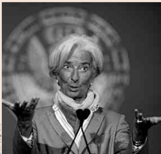
Christine Lagarde, directora gerente del FMI.

Es el resultado de una recuperación “decepcionante, frágil, desigual y acosada por los riesgos”, como dijo la ex ministra francesa durante un discurso en la Universidad de