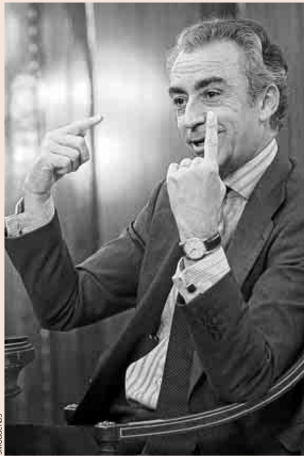
El secretario de Estado de Hacienda, Miguel Ferrer.

Según ese cambio, el porcentaje de integración en la base imponible de las rentas procedentes de la cesión del uso o explotación de los activos intangibles será del 40% (es decir, se establece una reducción del 60% de las rentas), tanto si los activos objeto de la cesión hubieran sido creados por la propia entidad cedente como si esa misma entidad hubiese adquirido los activos a terceros, en cuyo caso se exige que parte del desarrollo en I+D se haga en Espa-