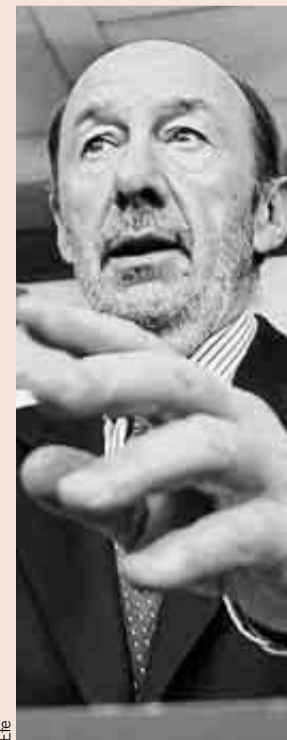
Alfredo Pérez Rubalcaba.

Respecto a la lista para las elecciones europeas, ha sostenido que todavía no ha “tomado ninguna decisión”, aunque lo hará “a no mucho tardar”, y no ha querido hablar del posible tándem Elena Valenciano-Ramón Jáuregui para encabezarla.