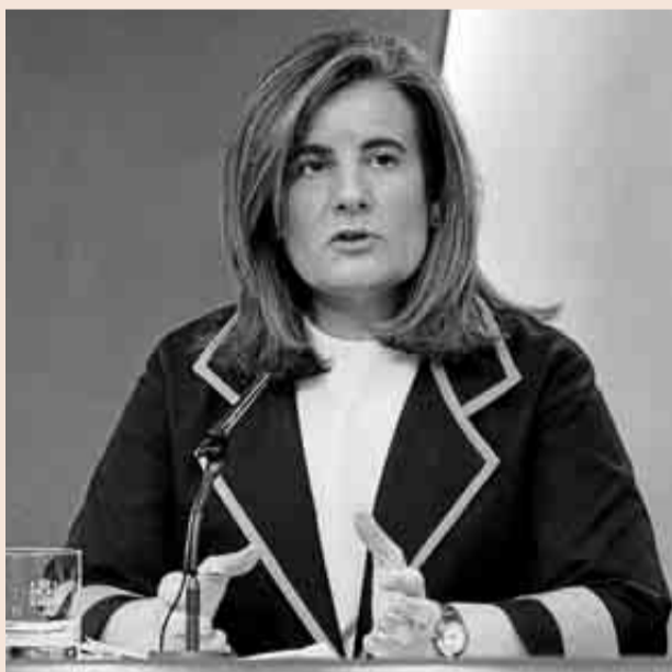
La ministra de Empleo, Fátima Báñez, en un acto el Ministerio.

cial, en agosto -último dato conocido- había 2.879.784 parados con prestación. La cifra total de parados en septiembre fue de 4.724.000.