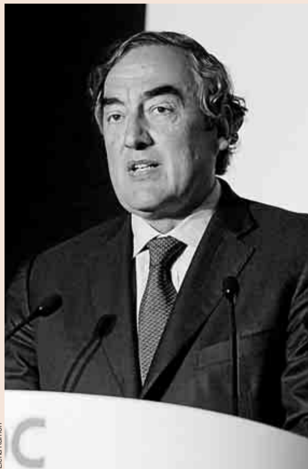
El presidente de la CEOE, Juan Rosell.

con todos los conceptos, reflejados en la Encuesta Trimestral de Costes Laborales, realizada por el INE, los salarios no superan el crecimiento del 1% desde 2009, cuando aumentaron un 3,2%. Incluso, en el primer trimestre de este año, los salarios cayeron un 0,2%, lo mismo que el conjunto de los costes laborales, que