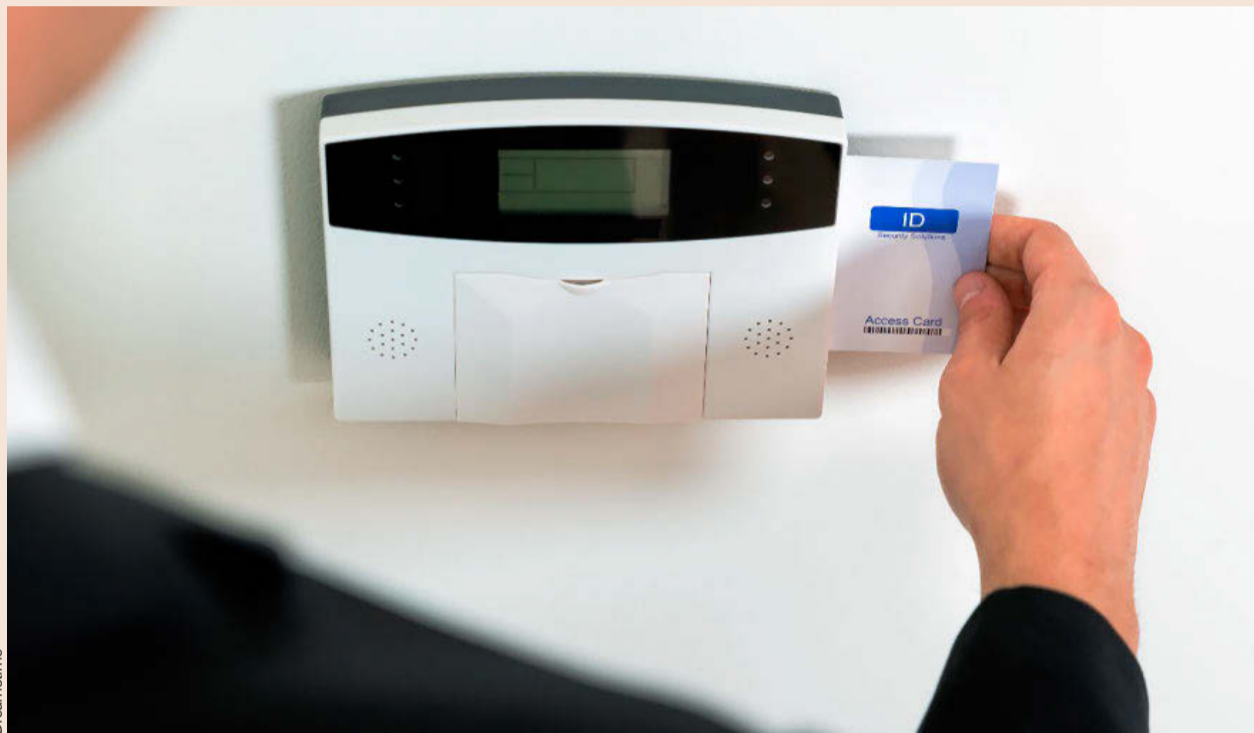
Trabajo aseguró recientemente que no hará excepciones en la aplicación del registro horario.

Así, en estos desplazamientos, que conllevan a menudo largas esperas e interrupciones, la Abogacía cree que deben establecerse unos criterios de tiempos de espera computables a los efectos de jornada efectiva de trabajo, interpretando que la solución debe considerar si el abogado dispone de cierto grado de li-