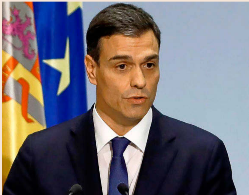
Pedro Sánchez, presidente del Gobierno.

La nueva ministra de Economía conoce bien su nuevo departamento. Trabajó en el Servicio de Defensa de la Competencia en la etapa de Luis de Guindos como secretario de Estado de Economía, y después en el Ejecutivo de Zapatero, llegando a ser directora general de Competencia.