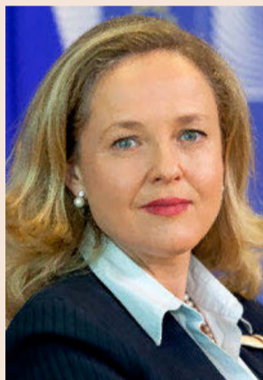
Nadia Calviño, nueva ministra de Economía.