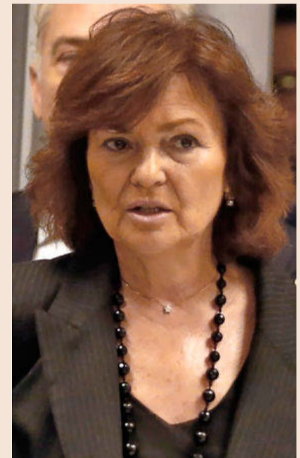
Carmen Calvo, vicepresidenta.