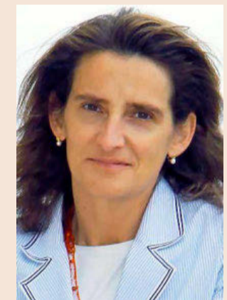
Teresa Ribera, ministra de Medio Ambiente y Energía.