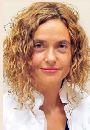
Meritxell Batet, ministra para la Administración Territorial.