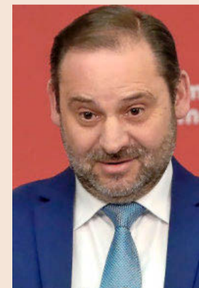
José Luis Ábalos, ministro de Fomento y número 3 del PSOE.