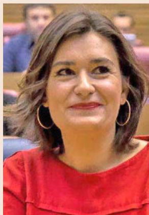
Carmen Montón será la ministra de Sanidad.