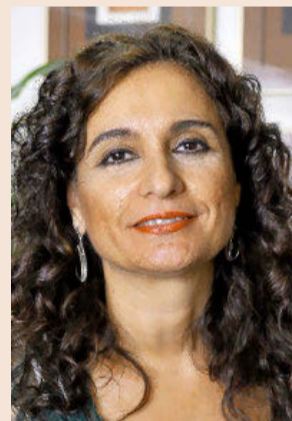
María Jesús Montero será la ministra de Hacienda.