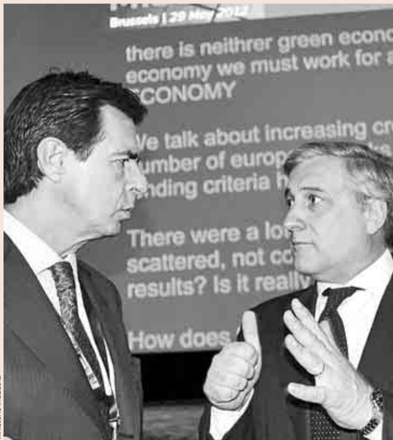
El ministro José Manuel Soria, con el comisario europeo de Industria, Antonio Tajani.

España cumplió con el 70%, pero se sitúa en los últimos puestos en aspectos clave a la hora de emprender o reorientar un negocio: la obten-