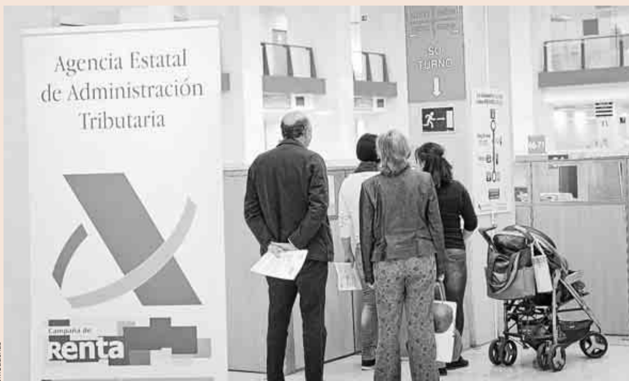
Contribuyentes en la Delegación de la Agencia Tributaria de la calle Guzmán el Bueno de Madrid.

Por tipos de rentas, Fedea estima que las rentas del trabajo dependiente se declaran totalmente y que incluso se sobredeclaran por error o des-