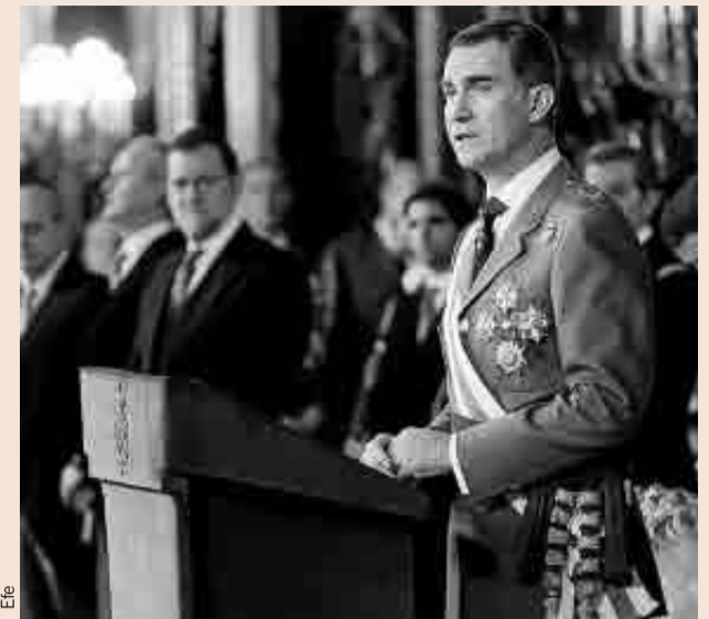
El rey Felipe VI, en su discurso de ayer; al fondo, Mariano Rajoy.

El barril de West Texas, de referencia en EEUU, cayó incluso por debajo de 34 dólares, hasta 33,96, el dato más bajo desde diciembre de 2008.