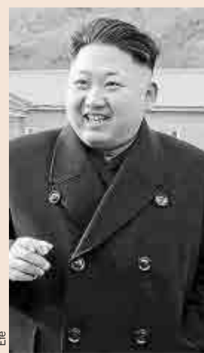
Kim Jong-un, máximo mandatario de Corea del Norte.