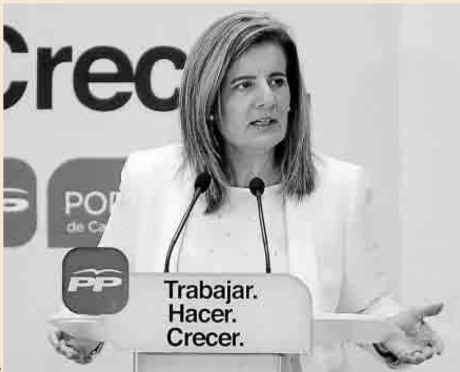
La ministra de Empleo y de Seguridad Social, Fátima Báñez.

Las cohortes de entre 25 y 44 años perderán más de 3,5 millones en los próximos diez años