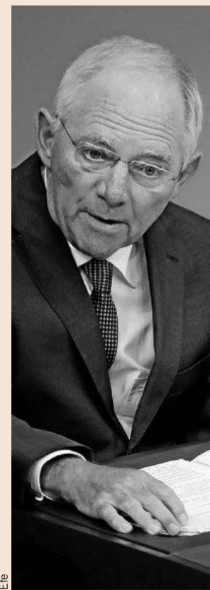
Wolfgang Schäuble, ministro alemán de Finanzas.

El titular de Finanzas también anunció un fuerte incremento del gasto en Defensa, en concreto, el presupuesto se elevará en 1.700 millones en 2017 respecto a este año y en 10.000 millones para 2020.