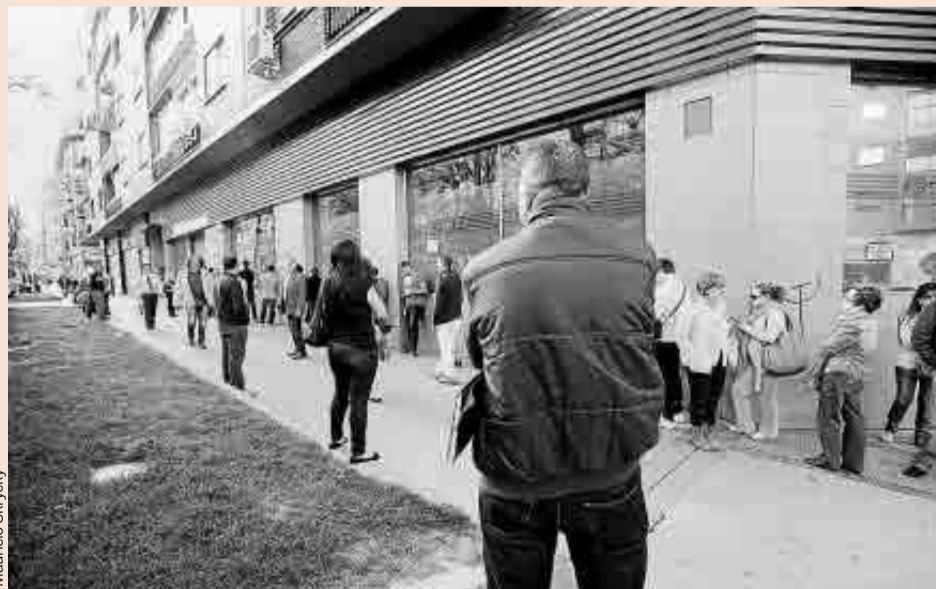
El paro afecta a 4,7 millones de personas, el 20,9% de la población activa.

Pocas relaciones hay tan claras en economía como la intensa asociación que existe entre las tasas de crecimiento del PIB y la ocupación. El gráfico de la siguiente página muestra la pareja evolución de las tasas de crecimiento interanual del PIB real y la ocupación desde el primer trimestre de 2003 hasta el tercer trimestre de 2015. Obsérvese que en 2003, 2004 y sobre todo en 2005, las tasas de crecimiento de la ocupación fueron superiores a las del PIB, que indicaba una caída preocupante del