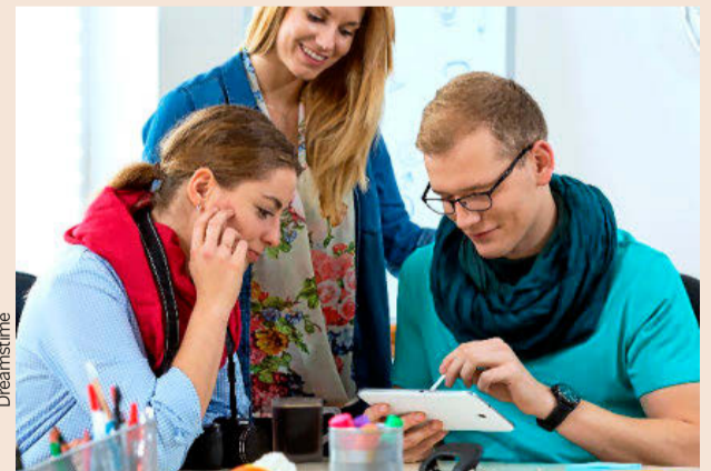
La 'tablet' será la única herramienta en las aulas de Esade Law School.

Para eso, Esade, en colaboración con Thomson Reuters, ha creado una herra-