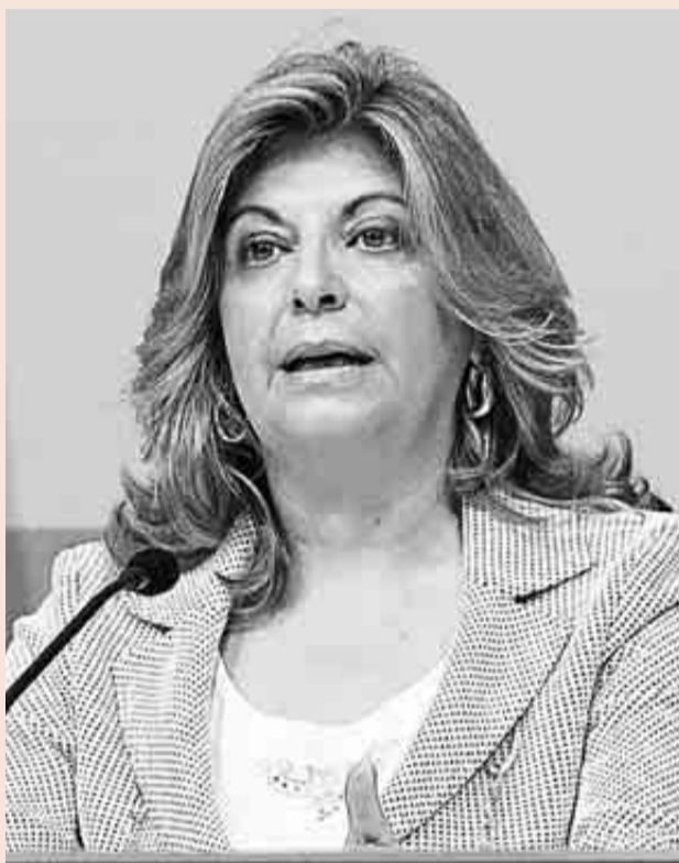
Engracia Hidalgo, secretaria de Estado de Empleo, ayer, en el Congreso.

de el Gobierno no llega a afectar directamente a más de 100.000 trabajadores. La mayoría empleados del hogar, trabajadores por horas y del campo.