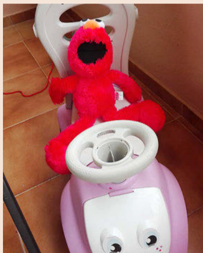
En busca de un líder carismático.