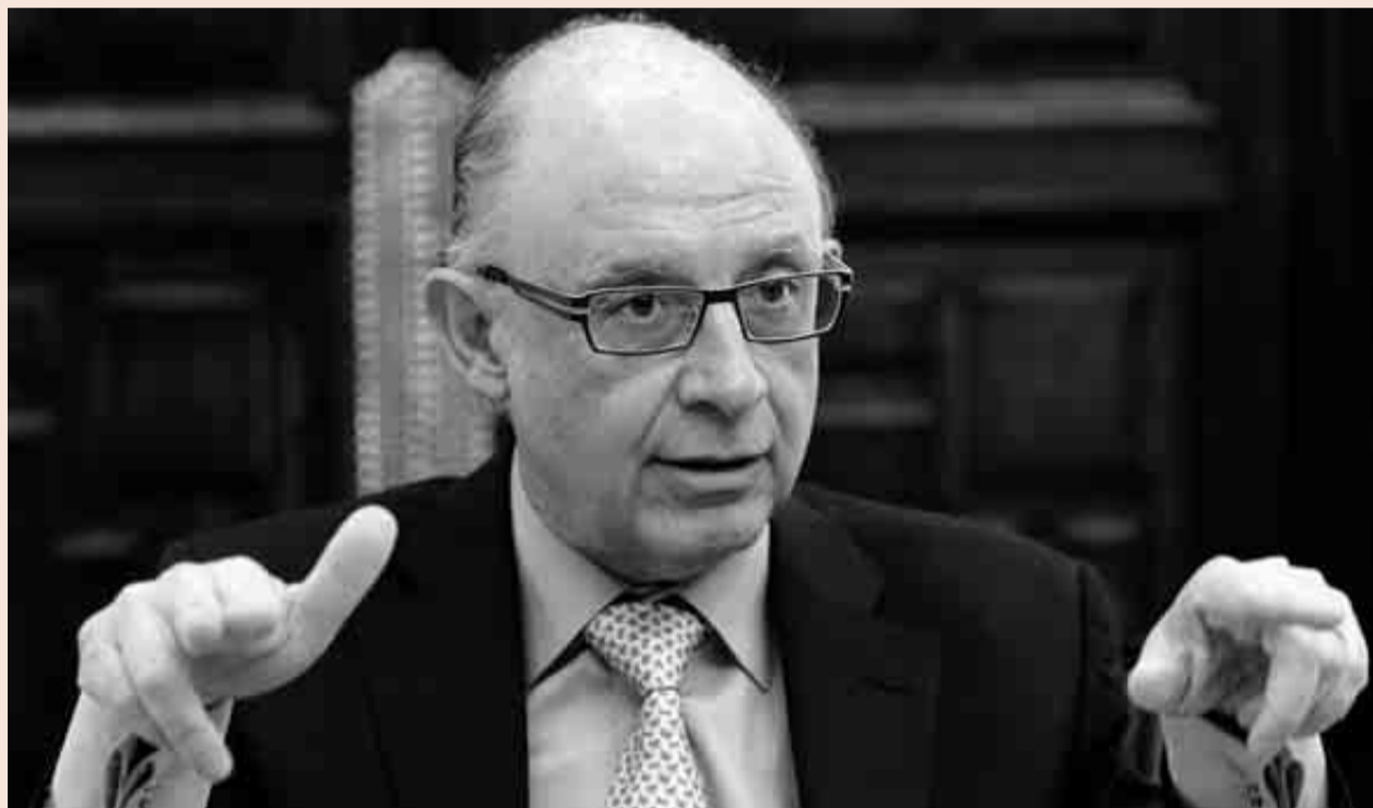
El ministro de Hacienda y Administraciones Públicas, Cristóbal Montoro.

En cuanto a la cuota, algunas están limitadas y otras no. Lo que ahora quiere Hacienda es eliminar las que no fomentan la inversión y reordenar y simplificar el sistema con un tope máximo de deducción global que evite que las grandes empresas con actividad internacional no paguen casi impuestos en España. De esta forma, las deducciones en cuota por doble im-