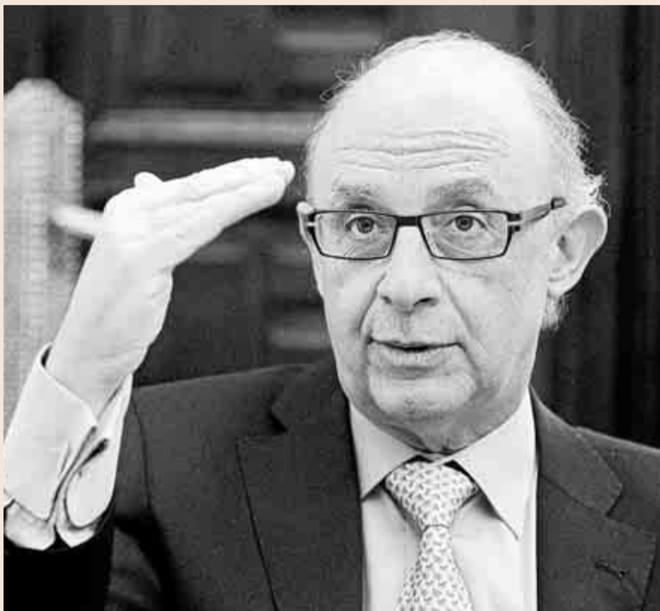
El ministro de Hacienda y Administraciones Públicas, Cristóbal Montoro.

El Gobierno está al acecho especialmente de aquellos ciudadanos que tienen deudas con Hacienda desde hace años. El Estado ingresó hasta noviembre 442 millones de euros de sanciones y multas que había impuesto años antes, que se encuadra dentro de la partida "Presupuestos ce-