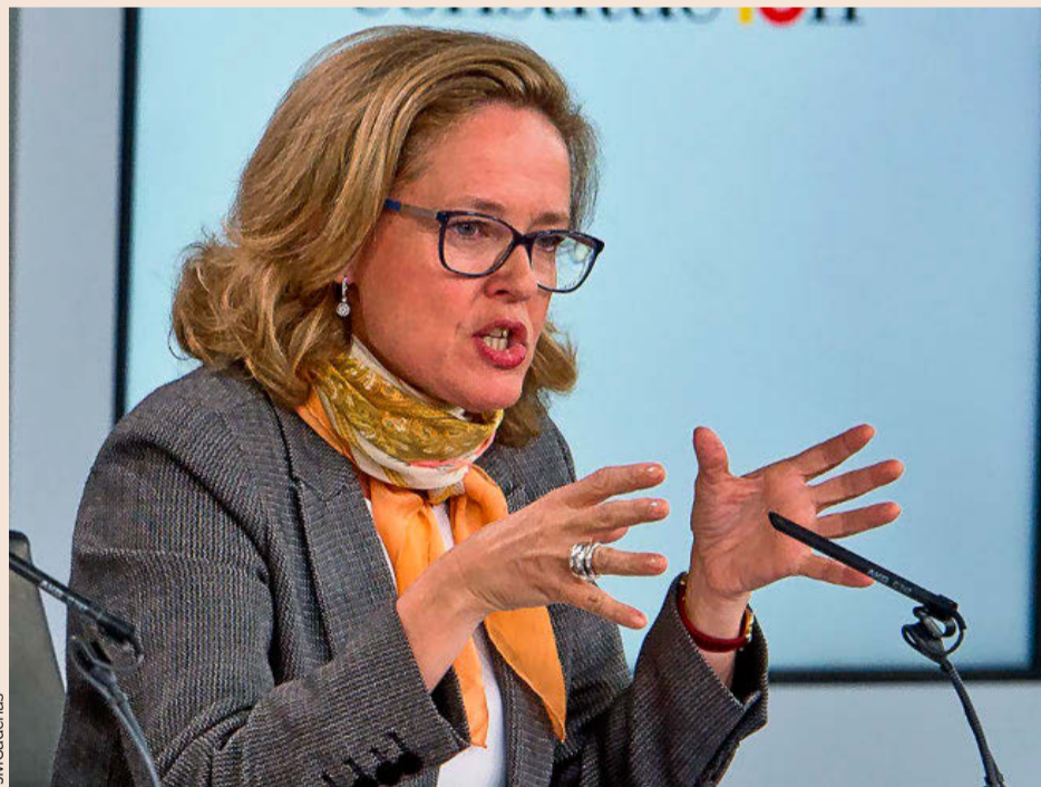
La ministra de Economía, Nadia Calviño.

De hecho, numerosos organismos de análisis macroeconómico habían alertado de