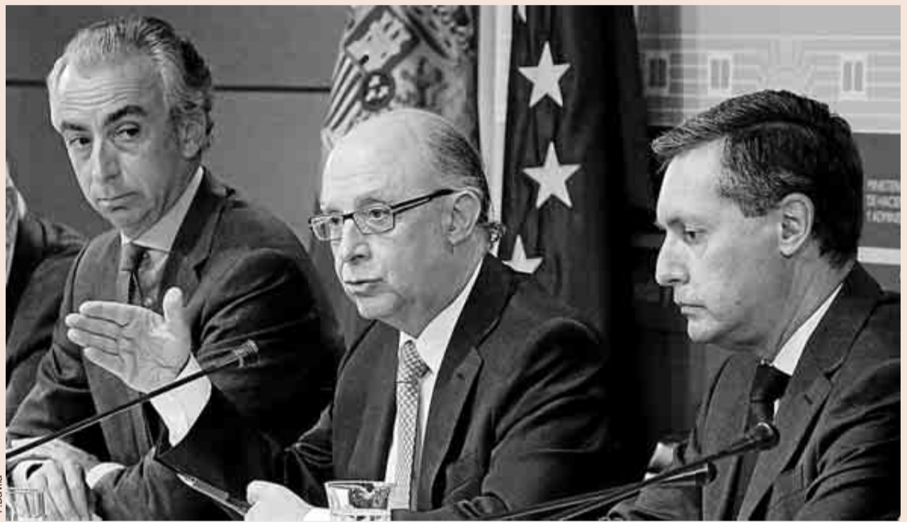
El secretario de Estado de Hacienda, Miguel Ferré; el ministro, Cristóbal Montoro, y el director de la Agencia Tributaria, Santiago Menéndez.

Los funcionarios tienen la carrera congelada desde 2010 y los Presupuestos del Estado para 2015 prevén que se mantenga así este año. Sin embargo, las centrales sindicales de la AEAT rechazan un incremento retributivo temporal, que no tendrá consolidación en su carrera y prefieren un alza menor, de unos 20 millones, que sí consolide, que es lo que supondría descongelar el acuerdo de carrera. Como adelantó EXPANSIÓN el pasado 23 de septiembre, la AEAT quiere reeditar este año el Plan Especial de variable de 2014 dentro de un modelo retributivo en el que crece el variable por objetivos pero no el fijo, con lo que no se consolida.