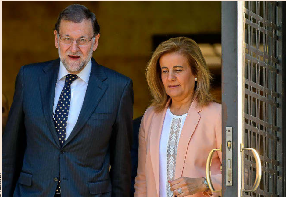
El presidente del Gobierno, Mariano Rajoy, con la ministra de Empleo y Seguridad Social, Fátima Báñez.

En este contexto, el impacto de la crisis en los ingresos del sistema por la fuerte destrucción de empleo es la razón de que, desde 2014, las