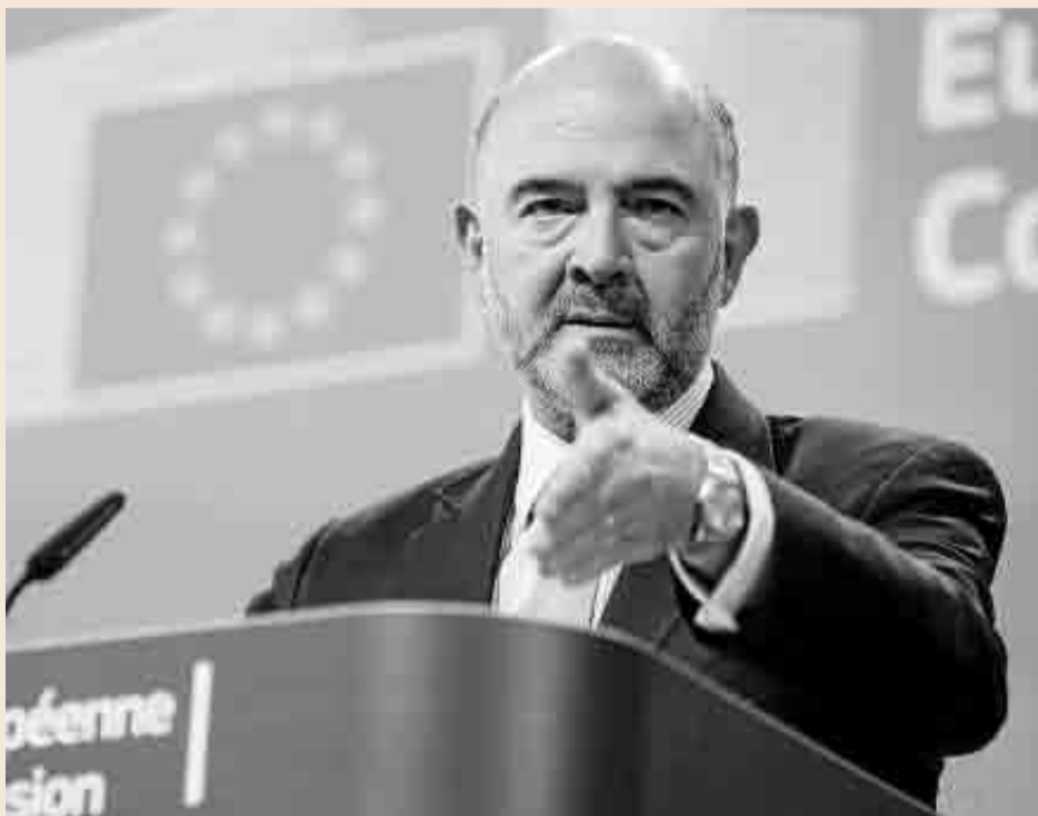
El comisario Pierre Moscovici, ayer en Bruselas, durante la presentación del informe.

Pero una vez que los técnicos han hecho su diagnóstico, llega el turno de modular el mensaje político. Y a menos de dos meses y medio de unas elecciones generales, a pocos en la Comisión se le escapa que este último es determinante. Todo empezó el lunes pasado, cuando el comisario de Asuntos Económicos, Pierre Moscovici, avanzó informalmente la opinión de la Comisión y enfatizó que Bruselas ponía deberes fiscales tan-