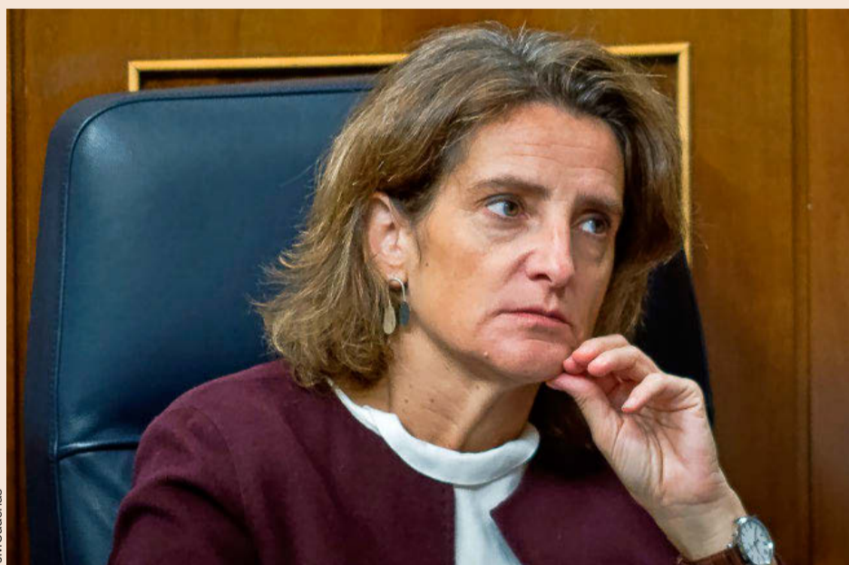
Teresa Ribera, ministra de Transición Ecológica, en el Congreso.

• Andamiaje institucional 'verde'. Se creará un Comité de Cambio Climático y Transición Energética para asesorar al Gobierno y elaborar un informe anual con los avances y retrocesos sobre los objetivos. Las autonomías y municipios de más de 100.000 habitantes tendrán que elaborar planes de energía. El Ministerio de Transición Ecológica elaborará informes sobre los riesgos climáticos, incluyendo medidas recomendadas para disminuir esta vulnerabilidad. Además, la planificación y la gestión hidrológica, costera y de las infraestructuras de transporte deberán considerar los riesgos derivados del cambio climático. Se incluirán medidas para compensar a los sectores y las zonas afectados por la transición ecológica y planes para recuperar la actividad. Y será obligatorio que las cotizadas elaboren un informe de riesgo climático y el Banco de España realizará un informe sobre el riesgo para el sistema financiero español cada dos años.