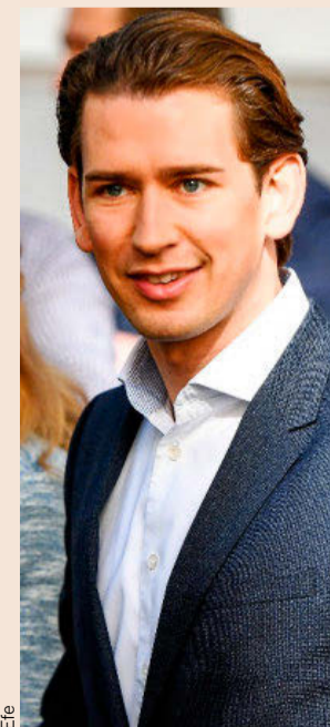
Sebastian Kurz, líder del ÖVP.

Unos 6,4 millones de votantes estaban llamados a las urnas en unas elecciones anticipadas. Hay 890.000 votos por correo, cuyo recuento puede ser decisivo para determinar la segunda y tercera posición.