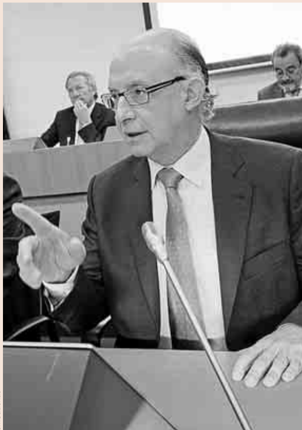
El ministro de Hacienda, Cristóbal Montoro.

narias (6,5%); Aragón, La Rioja y País Vasco (7%), y Castilla-La Mancha, Cataluña y Murcia (6,5%).