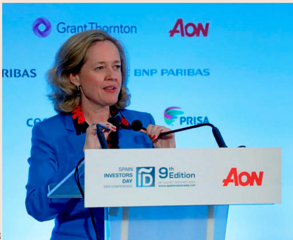
La ministra de Economía, Nadia Calviño, ayer durante el acto de clausura del 'Spain Investors Day'.

Calviño, que recordó durante la jornada los vientos en contra que ahondarán en la ralentización de la economía española este año, mostró la especial preocupación del Gobierno por la posición en la que quedaría España ante un Brexit sin acuerdo. Una situación para la que el Ejecutivo está "tratando de prepararnos lo mejor posible, aumentando la preparación de las compañías y te-