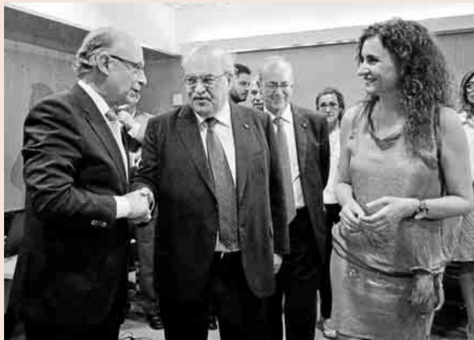
El ministro de Hacienda, Cristóbal Montoro, junto al consejero de Hacienda catalán, Andreu Mas-Colell y la de Andalucía, María J. Montero.

Los impuestos propios y las subidas de los impuestos autonómicos generan también numerosos pleitos que se alargan varios años. Las empresas y los contribuyentes particulares alegan que la región grava el mismo concepto dos o, in-