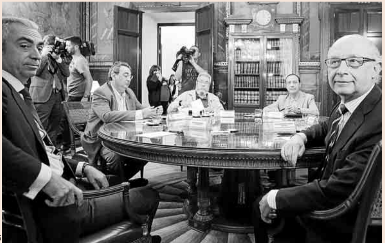
De izda. a decha., el secretario de Estado de Hacienda, Miguel Ferré; el secretario de Acción Sindical de UGT, Toni Ferrer; el secretario general de UGT, Cándido Méndez; el secretario de Protección Social de CCOO, Carlos Bravo, y el ministro de Hacienda, Cristóbal Montoro, ayer.

De entrada, la cuantía de la rebaja prevista se ha incrementado tanto en el IRPF como en el Impuesto sobre Sociedades y ahora el Ejecutivo subraya que será "sustancial". El Gobierno envió a Bruselas en el Programa de Estabilidad el 30 de abril que iba a rebajar el IRPF 5.000 millones de euros entre 2015 y 2016 a razón de 2.500 millones cada año. Ahora ha incrementado el alcance de la bajada a más de 7.000 millones y va a rebajar el tipo de todos los tramos. Moncloa ha instado a que baje el marginal máximo. Algunos miembros del Ejecutivo creen que un tipo marginal máximo por encima del 50% es "confiscatorio" e impropio de un país que quiera competir en la UE, cuando la media es del 45%.