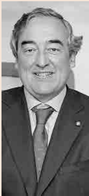
El presidente de la CEOE, Juan Rosell.