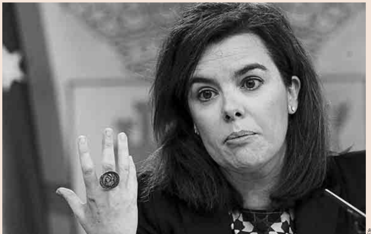
La vicepresidenta del Gobierno, Soraya Sáenz de Santamaría, ha encabezado los trabajos de la Comisión de Reforma de las Administraciones.

Aunque el propio Gobierno reconoce que no se podrá arrebatar por la fuerza las competencias a las regiones (chocaría con lo que proclaman los estatutos de autonomía, que tienen rango de Ley orgánica), Rajoy sí que tiene postestad para desvelar a los ciudadanos qué servicios públicos prestan sus comunidades y qué empresas públicas se mantienen a pesar de que una gestión centralizada sería mucho más eficiente y generaría un ahorro del que podrían beneficiarse los contribuyentes mediante rebajas fiscales. De hecho, muchas autonomías –es el caso de la Comunidad de Madrid con la