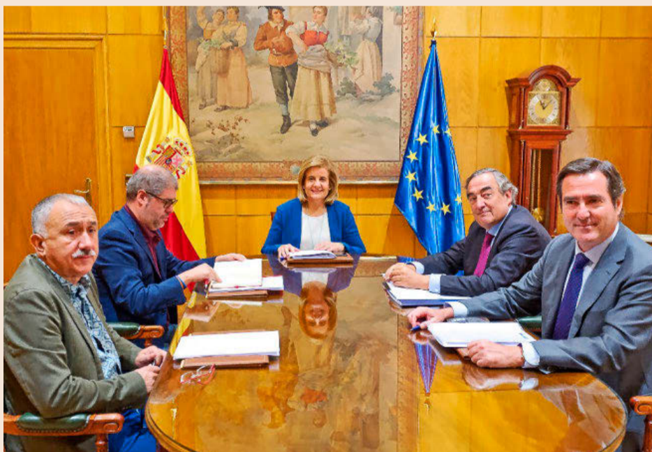
De izquierda a derecha, ayer, los dirigentes de UGT, Pepe Álvarez, y CCOO, Unai Sordo; la ministra de Empleo, Fátima Báñez, y los presidentes de CEOE, Juan Rosell, y de Cepyme, Antonio Garamendi.

la oposición y de CCOO y UGT la recuperación está creando mucho empleo, pero de bajos salarios y condiciones laborales precarias.