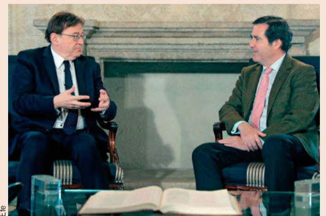
Garamendi, ayer, durante su reunión con el presidente Ximo Puig.

Las empresas necesitan "seguridad jurídica e institucional. Mientras haya indefinición y este clima de crispación en la sociedad civil, afec-