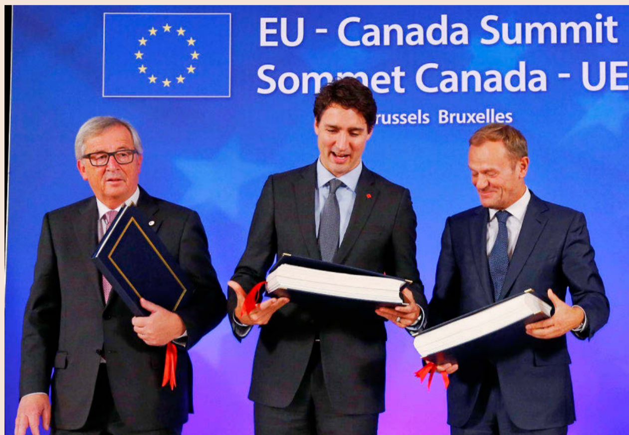
Jean-Claude Juncker, Justin Trudeau y Donald Tusk, del Consejo Europeo, en la firma del CETA, el 30 de octubre de 2016.

La medida central del CETA es la reducción de las aduanas: el 98% de ellas desaparecen con este tratado. La mayoría de ellas, lo harán ya desde hoy. Pero algunos impuestos canadienses a las importaciones pesqueras, agrícolas e industriales desaparecerán gradualmente en los próximos 7 años. En total, esto supondrá un ahorro a las em-