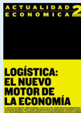
Portada del dossier.