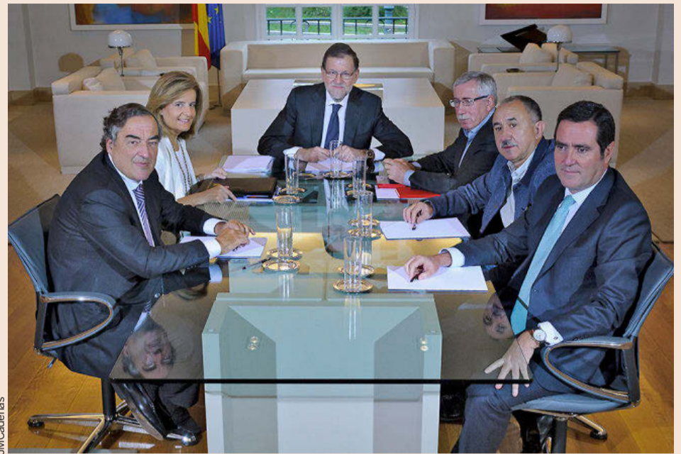
Los protagonistas de la negociación colectiva: Rosell, Báñez, Rajoy, Fernández Toxo, Álvarez y Garamendi.

Feito asegura que algunos de estos efectos, como la reducción de la jornada y el aumento de la contratación temporal y a tiempo parcial, serán inmediatamente visibles. Otros cree que serán más difíciles de detectar porque "serán anegados por el aumento del empleo y la reducción del paro inherentes al crecimiento de la economía, si bien, como ocurrió en el pa-