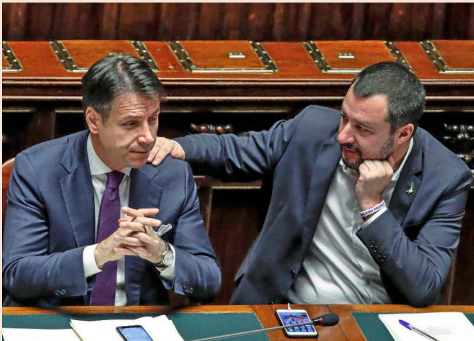
El primer ministro italiano, Giuseppe Conte, y el vicepresidente, Matteo Salvini, ayer en Roma.