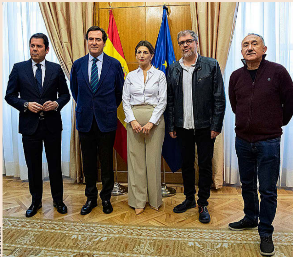
La ministra de Trabajo, Yolanda Díaz, anoche, con los dirigentes de CEOE y Cepyme, y de CCOO y UGT.

La ministra también ha rebajado sus pretensiones ante su jefa, la vicepresidenta para Asuntos Económicos, Nadia Calviño, y la vicepresidenta