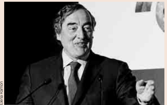
El presidente de la CEOE, Juan Rosell.

tos". "¿Serían capaces estos 11 millones de [trabajadores indefinidos] de transferir parte de sus derechos a estos cuatro millones [de empleados temporales], de forma que unos perdieran y otros ganasen y así tendríamos más o menos las mismas reglas de juego y consideraciones?", se preguntó, para a continuación responderse a sí mismo: los trabajadores de mayor edad "son incapaces" de trasladar sus derechos laborales a sus descendientes "por muchos hijos