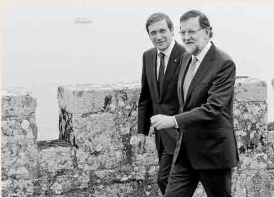
El presidente del Gobierno, Mariano Rajoy, y el primer ministro luso, Pedro Passos Coelho, ayer tras la cumbre bilateral celebrada en Baiona.

Alfonso Alonso, ministro de Sanidad y figura emergente en el partido, llegó a decir la semana pasada a los periodistas que los cambios en el Gobierno se producirían el jueves pasado. Finalmente sólo se produjo el nombramiento de nuevos vicesecretarios en