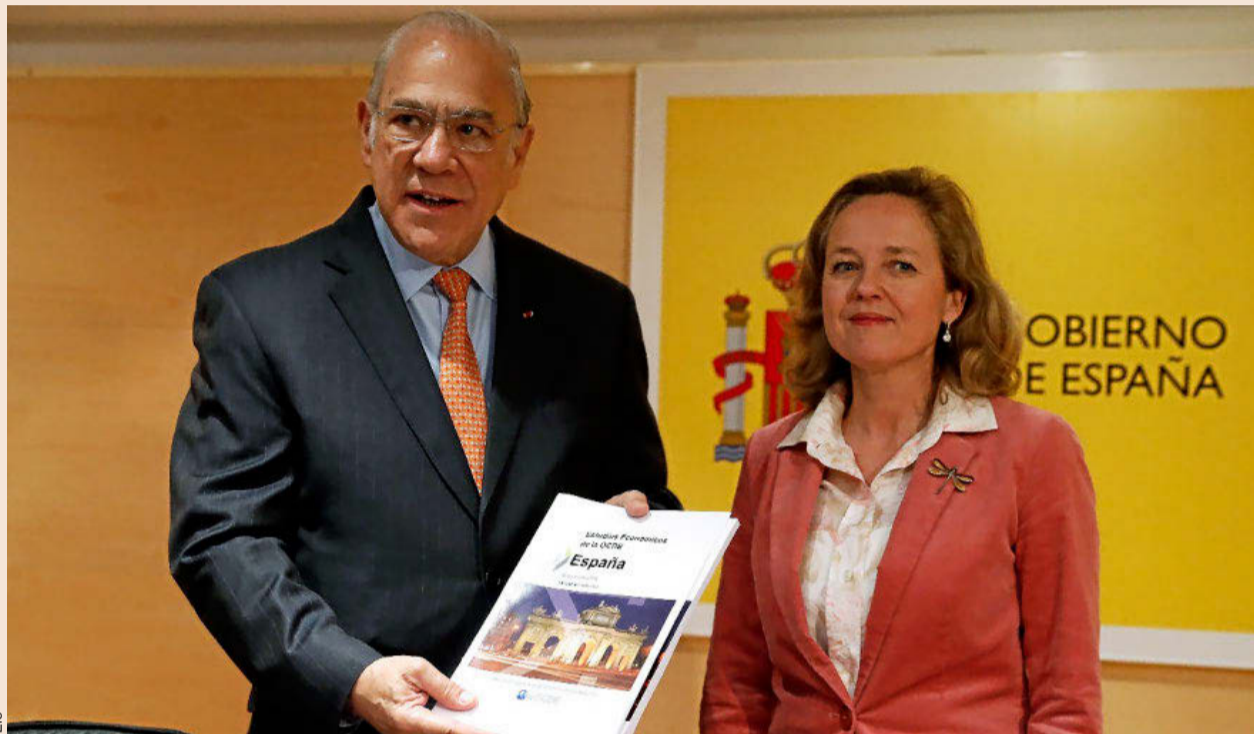
Ángel Gurría, secretario general de la OCDE, junto a Nadia Calviño, ministra de Economía, en la presentación del informe, ayer en Madrid.

Sobre la última cuestión, la OCDE alerta de que en España “existen fuertes desincentivos para seguir trabajando al mismo tiempo que se percibe una pensión íntegra”. Pone especial énfasis en el caso concreto de los autónomos, para los que la cuantía de la prestación se reduce un 50% y además deben pagar una cotización especial del 8%. “El tipo impositivo marginal