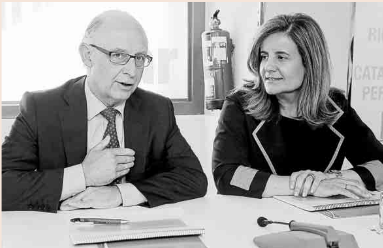
Cristóbal Montoro, ministro de Hacienda y Administraciones Públicas, y Fátima Báñez, ministra de Empleo.

Estos planes de incentivos salariales, además, quedarán