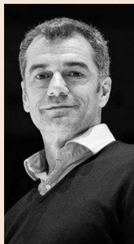
El actor y guionista Toni Cantó, exdiputado de C's.