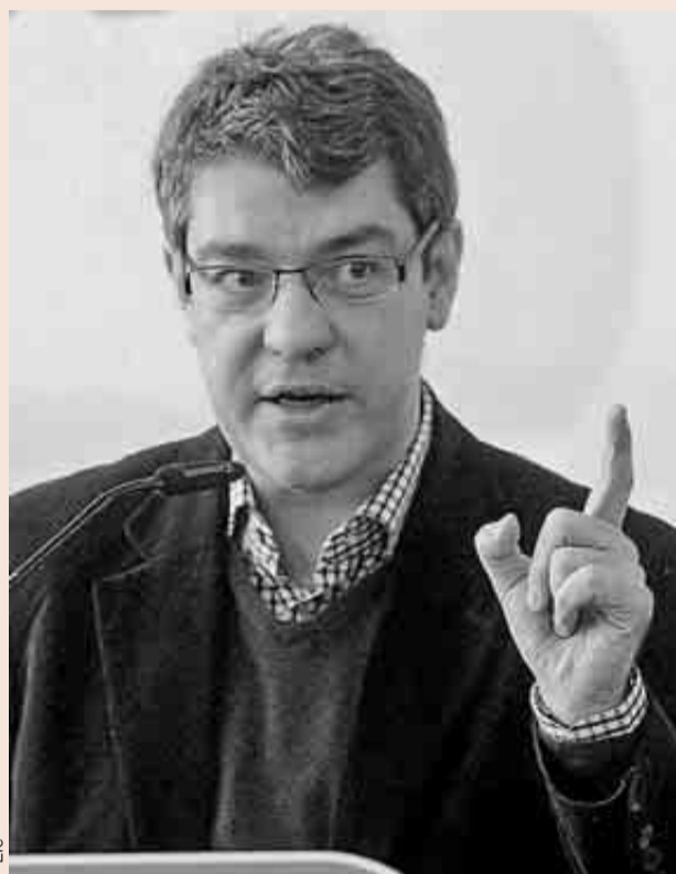
El jefe de la Oficina Económica de La Moncloa, Álvaro Nadal.

El asesor de Rajoy también explicó por qué el PP parece no haber materializado electoralmente los logros económicos. En su opinión, en España “hay una tendencia a informar mucho de las malas noti-