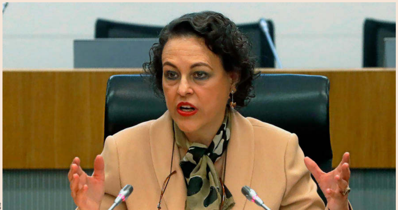
Magedalena Valero, ministra de Trabajo, Migraciones y Seguridad Social.

Se trata no solamente del mayor incremento que se ha introducido en las últimas décadas, sino que además se suma a todos los que se han producido durante el último lustro (ver gráfico en esta página). Tanto en 2013 como en 2014 las bases máximas aumentaron un 5% anual, reduciéndose posteriormente el ritmo con un 0,25% de subida en 2015 y