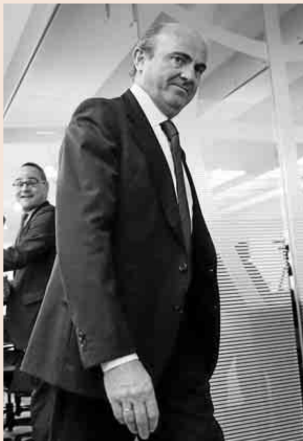
Luis de Guindos, ministro de Economía.

Sin embargo, establece que se considerará al adquirente de la unidad productiva sucesor de la empresa concursada en lo relativo a su deuda ante la Seguridad Social: "Cuando, como consecuencia de la enajenación el conjunto de la empresa o de determinadas unidades productivas, una enti-